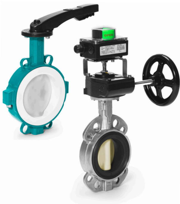
Desponia® plus, дисковые затворы с уплотнением из EPDM и Bianca, дисковый затвор с футеровкой из PTFE

Основными преимуществами есть большой опыт и глубокий опыт наших специалистов, широкий ассортимент продукции и аксессуаров, долговечность и эксплуатационные характеристики арматуры и - самое главное - компетентность, надежность и преданность делу сотрудников компании InterApp.